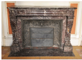
Старинный камин в стиле Наполеона III, выполненный из Красного Левенто в XIX веке