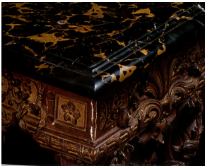
Элемент позолоченной и инкрустированной деревянной консоли, отделанной мрамором Портор, XVIII век.